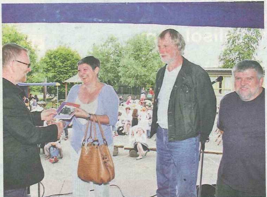
Hoog bezoek in de Booischootse Freinetschool.