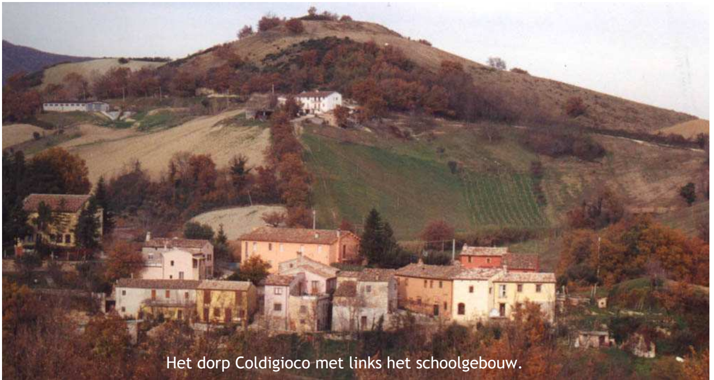
Het dorp Coldigioco met links het schoolgebouw.