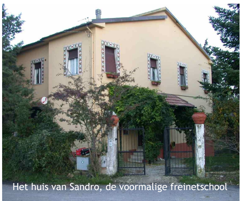
Het huis van Sandro, de voormalige freinetschool